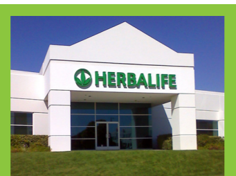
H.I.M. Lake Forest, California (Fabricación de productos)