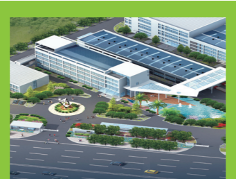
H.I.M. Changsha, China (Extracción de botánicos)