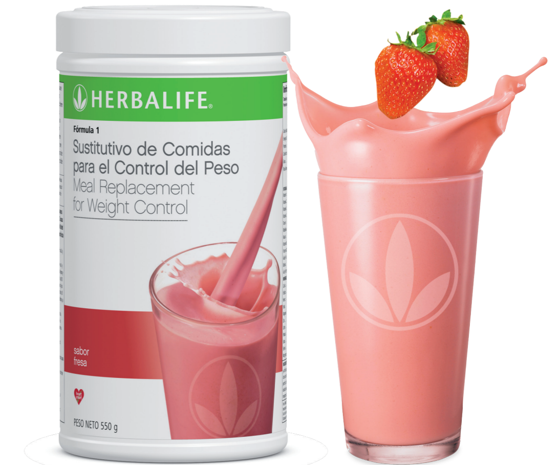
La fotografía de este producto es referencial, la etiqueta puede variar según el país.

Productos que combinan lo mejor de la ciencia y la naturaleza para brindarle bienestar.