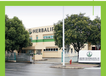
H.I.M. Suzhou, China (Fabricación de productos)